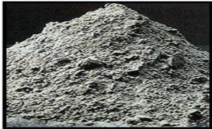
Gambar 2.1 Abu Terbang ( Fly Ash ) Batubara

Sebenarnya abu terbang ( fly ash ) tidak memiliki kemampuan mengikat seperti halnya semen, namun dengan kehadiran air dan ukurannya yang halus, oksida silika yang dikandung didalam abu batubara akan bereaksi secara kimia dengan kalsium hidroksida yang terbentuk dari proses hidrasi semen dan akan menghasilkan zat yang memiliki kemampuan yang mengikat (Djiwanto, 2001).